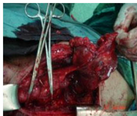
شکل شماره 4- خونگیری توده در محل تیموس در مدیاستن قدامی از عروق داخل قفسه صدی از شریان

در بررسی های قبل از عمل اکو قلب در محدوده نرمال (EF=60) قرارداد و اسپیرومتری نمای انسدادی را مطرح کرده بود. آزمایشات قبل از عمل Hb-CBC- هورمونهای تیروئید، TSH-LDH-aFP-HCG و الکترولیت ها نرمال بودند. بیمار تحت عمل جراحی با برش T در گردن و استرنوتومی نسبی قرار گرفت که در بررسی تیروئید لوب راست به صورت ندول بزرگ بود لوب چپ تقریباً در حد نرمال بود و یک توده به ابعاد 85×60×60 در محل تیموس در مدیاستن قدامی وجود داشت که خونگیری آن از عروق داخل قفسه صدی از شریان و ورید بی نام بود که (شکل 4 و 5) در بررسی پاتولوژی از بیمار گواتر مولتی ندولر کیستیک گزارش گردید شکل (6). در follow up چهار ماه بعد کلیه علائم بیمار از بین رفته بود