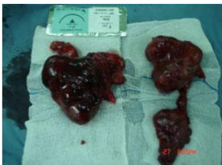
شکل شماره 5- خونگیری توده در محل تیموس در مدیاستن قدامی از عروق داخل قفسه صدی از شریان و ورید