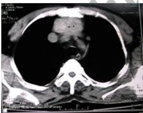
شکل شماره 2- توده بافت نرم در مدياستن قدامی فوقانی در سی تی اسکن

در سی تی اسکن انجام گرفته از قفسه صدري یک توده بافت نرم به ابعاد 60 \times 40 \times 85 mm در مدياستن قدامی فوقانی در قدام تراشه و در خلف استرنوم با گسترش تا حد کارینا گزارش گردیده است. شکل (2).