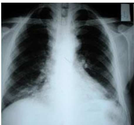
شکل شماره 1- وجود توده در مدياستن قدامی فوقانی بیمار

بیمار مردی 61 ساله که با توده قدام گردنی از چند سال قبل که از حدود 6 ماه پیش از مراجعه بدنبال فعالیت دچار خس خس سینه و تنگی نفس می گردید. در بررسی انجام گرفته در CXR توده در مدياستن قدامی فوقانی بیمار دارد شکل (1).