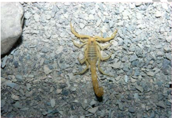
شکل ۲ عقرب ماده Buthacus leptochelys

می رسد. رنگ بدن در سطح پشتی زرد کم رنگ تا کدر اما اعضای آن روشن تر است. سپر سری (کاراپاس) بدون گرانول و بر حسب فرم محلی صاف یا با گرانولهای پراکنده، چشمهای جانبی کوچک است. تعداد دندانهای شانه در نرها ۳۰-۳۲ و در ماده ها ۲۵-۲۷ عدد می باشد (شکل ۲).