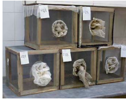
شکل ۱ سمت راست: قفس‌های نگهداری پشه‌های بالغ. سمت چپ: لیوانهای محتوی لارو