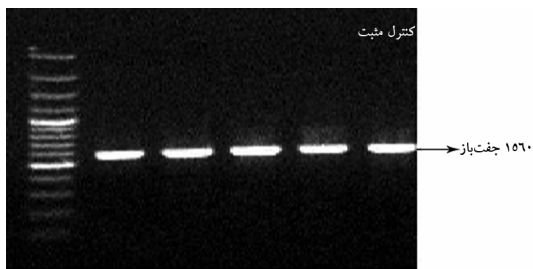
شکل ۱. تصویر مربوط به قطعه ۱۵۶۰ جفت‌بازی ژن NP

بعد از واکنش RT-PCR و الکتروفورز، محصول باند مورد نظر بدون باند غیراختصاصی ظاهر شد و تشکیل باند در کنترل مثبت و عدم ایجاد باند در کنترل منفی نشانگر صحت واکنش RT-PCR بود (شکل ۱).