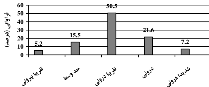
نمودار ۱: درصد فراوانی واحدهای مورد پژوهش از نظر نوع منبع کنترل در موقعیت‌های موفقیت

در خصوص نوع منبع کنترل بر حسب جنس، یافته‌های این مطالعه هیچ گونه تفاوت معنی‌داری را بین دو جنس از نظر منبع کنترل نشان ندادند. بدین معنی که نوع منبع کنترل در دو جنس تقریباً یکسان است. در خصوص ارتباط بین منبع کنترل و پیشرفت تحصیلی که هدف عمده این پژوهش نیز می‌باشد، آزمون ضریب همبستگی پیرسون هیچگونه ارتباطی را بین نمرات مربوط به منبع کنترل و میانگین نمرات دانشجویان نشان نداد، که این موضوع در مورد هر دو جنس صد می‌کند. همچنین آزمون تی نیز در تأیید یافته‌های فوق نشان داد که بین میانگین نمره مربوط به منبع کنترل در دو گروه دانشجویان با پیشرفت تحصیلی بالا و دانشجویان با پیشرفت تحصیلی پایین هیچگونه تفاوت معنی‌داری وجود ندارد.