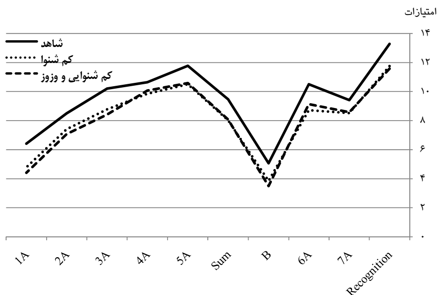
نمودار ۲: میانگین امتیازات نه مرحله RAVLT در سه گروه مورد بررسی.

افراد دچار وزوز تکمیل گردید. براساس نتایج پرسشنامه، سطح شدت معلولیت ناشی از وزوز در سطح متوسط (امتیاز ۳۶ تا ۵۶ از ۱۰۰) قرار داشت.