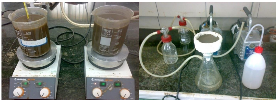
شکل ۱: مراحل آماده سازی جاذب باگاس