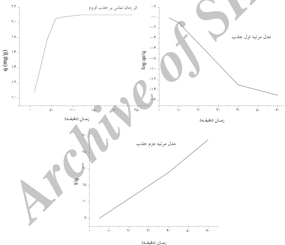
نمودار ۲: اثر زمان تماس بر جذب کروم، مدل مرتبه اول و دوم جذب کروم بوسیله جاذب باگاس شرایط آزمایش (سرعت همزن = 250 rpm، غلظت = 100 ppm، غلظت باگاس = 20 gr/lit، دما = 50°C، اندازه ذرات = 500-420 \mu\text{m} ، pH=2)

در شرایط بهینه را ۹۲/۳ درصد ارزیابی نموده بود تقریباً مطابقت دارد.