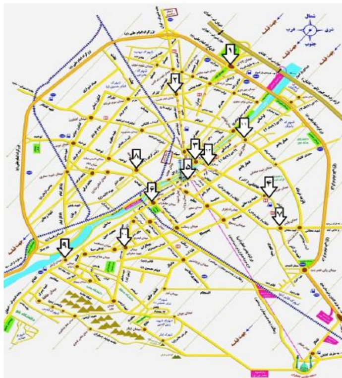
تصویر ۱. ایستگاه‌های منتخب اندازه‌گیری آلودگی صوتی در شهر قم در سال ۱۳۹۱.

شهر قم مرکز استان قم است. این شهر همسایه تهران و پل ارتباطی استان‌های شمالی و جنوبی است و به دلیل داشتن