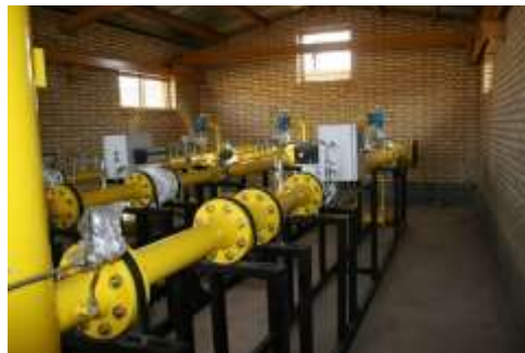
شکل ۱. نمونه‌ای از ایستگاه‌های تقلیل فشار گاز شهری

در پژوهش توصیفی - تحلیلی و مقطعی حاضر با هدف ارزیابی و ارائه طرح مداخله فنی - مهندسی جهت کنترل صدای شغلی، در ابتدا اطلاعات پایه مورد نظر و افراد در معرض صدا در ۱۲ ایستگاه تقلیل فشار گاز جمع‌آوری شد. موقعیت جغرافیایی، ظرفیت خروجی، تعداد خطوط انتقال گاز و اطلاعات فنی مورد نیاز مشخص شد و در نهایت با بازدید صورت‌گرفته ابعاد، جنس سطوح و اجزای مولد صدا در هر ایستگاه تعیین گردید. سپس براساس اطلاعات به‌دست‌آمده ارزیابی در چند مرحله صورت گرفت و در نهایت طرح‌های کنترلی صدا متناسب با موقعیت ارائه و تحلیل شد. نمونه‌ای از ایستگاه‌های تقلیل فشار گاز شهری در شکل ۱ نمایش داده شده است.