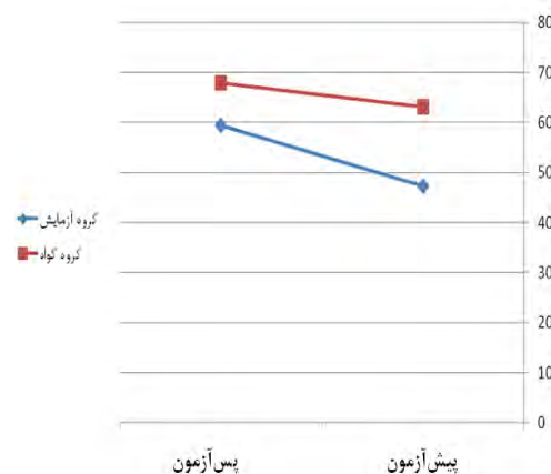
شکل ۳- سیر تغییر نمرات میانگین درک مطلب پیش آزمون و پس آزمون در گروه آزمایش و گروه گواه