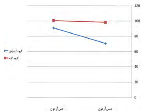
شکل ۲- سیر تغییر نمرات میانگین صحت خواندن پیش-آزمون و پس آزمون در گروه آزمایش و گروه گواه

به منظور آزمون تأثیر مداخله دیداری بر کاهش غلط‌های خواندن، ابتدا تفاوت نمرات پیش آزمون و پس آزمون مربوط به هر یک از غلط‌های خواندن برای هر دو گروه (آزمایش و گواه) محاسبه شد و میانگین نمرات حاصل با استفاده از آزمون t مستقل با \alpha = 0/05 مقایسه گردید. نتایج حاصل از این آزمون در جدول ۳ نمایش داده شده است. همانطور که مشاهده می‌شود تفاوت میانگین گروه‌ها برای دو نوع غلط حذف و تلفظ نادرست معنادار می‌باشد. به عبارت دیگر پس از انجام مداخله تعداد این دو نوع غلط به طور معناداری در گروه آزمایش کاهش یافته بودند. علاوه بر این همانطور که مشاهده می‌گردد میانگین غلط‌های اضافه سازی نیز که یکی دیگر از غلط‌های مرتبط با کارکردهای دیداری است از ۲/۹ به ۱/۴ کاهش یافته بود ولی این تغییر از نظر آماری معنادار نبود. میانگین تجزیه کردن نیز از ۲/۷ به ۰/۳ کاهش یافته است ولی