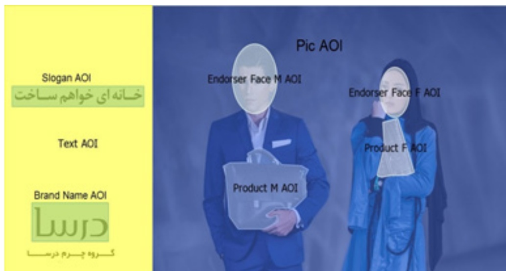
تصویر ۱- نمونه تصویری AOI تعریف شده در دو تبلیغ هدف