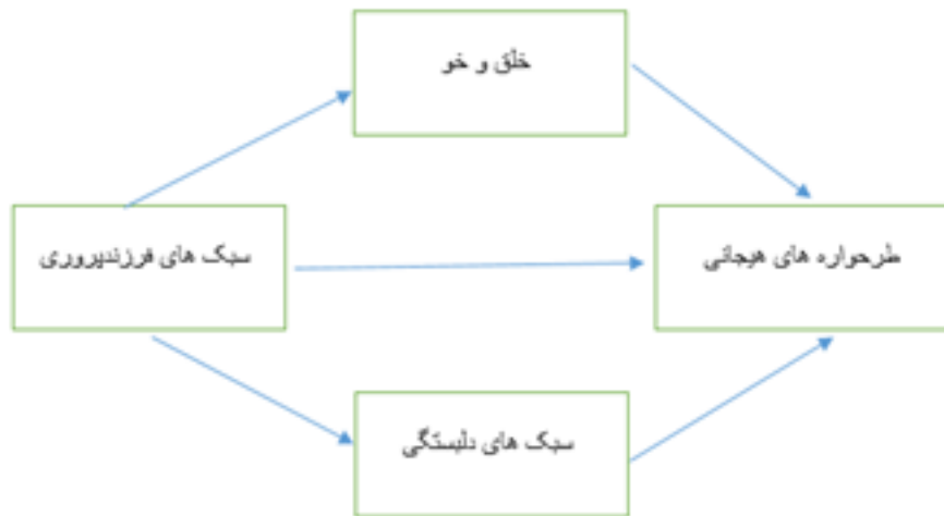
شکل ۱. مدل فرضی پژوهشی برگرفته از مطالعات پیشین

نقش واسطه‌ای را در ارتباط با طرحواره‌های ناسازگار با سبک‌های فرزندپروری دانشجویان داشته باشد؟ همچنین فرضیه‌های این پژوهش عبارتند از: فرضیه اول: سبک‌های فرزندپروری بر طرحواره‌های ناسازگار