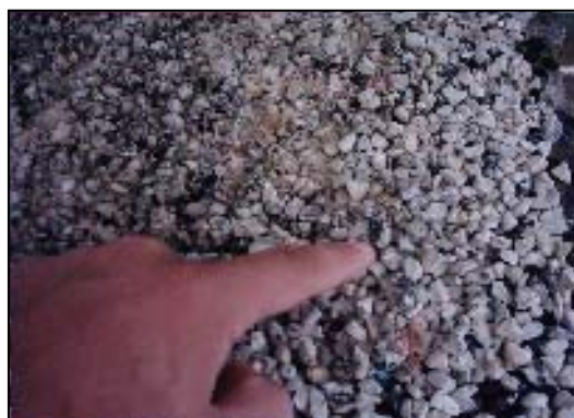
شکل ۱. اثر بار اضافی و خردشدگی سنگدانه‌ها، همچنین اثر میزان سنگدانه اضافی

قرار گیرند. برای مدل سازی چنین حالتی سعی شد تا تعداد دور رفت و برگشت دستگاه بیش از مقدار لازم باشد.