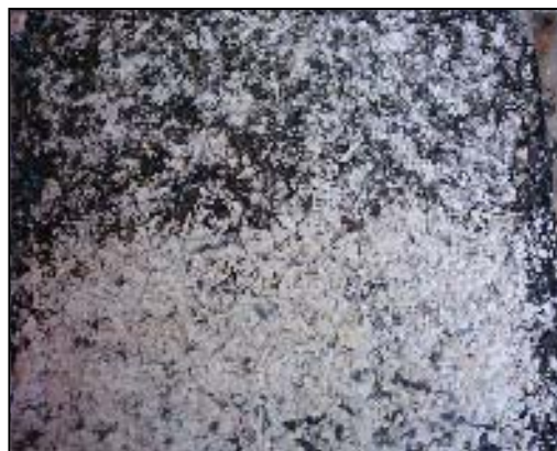
شکل ۴. بافت اندود سنگدانه‌ای گرانیت A

در این تحقیق عمق زبری اندودها توسط آزمایش پخش ماسه، و اصطکاک سطح اندود به وسیلهٔ دستگاه آونگ انگلیسی اندازه‌گیری شده است.