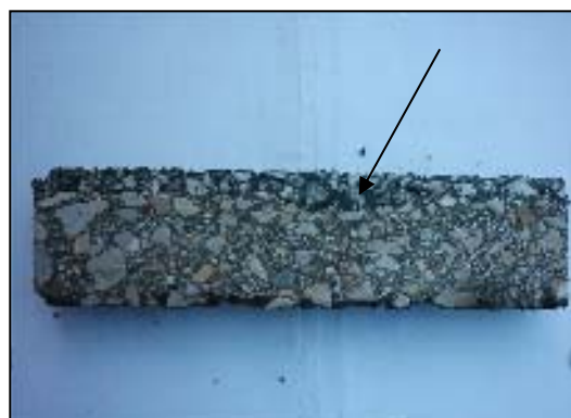
شکل ۲. میزان نفوذ سنگدانه‌های گرانیتی B