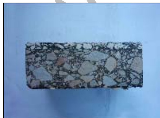
شکل ۳. مقطع اندود دولایه با محل شیار