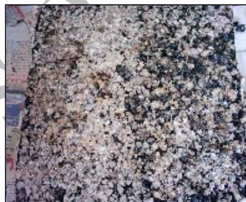
شکل ۵. بافت و مقطع اندود سنگدانه‌ای آهکی