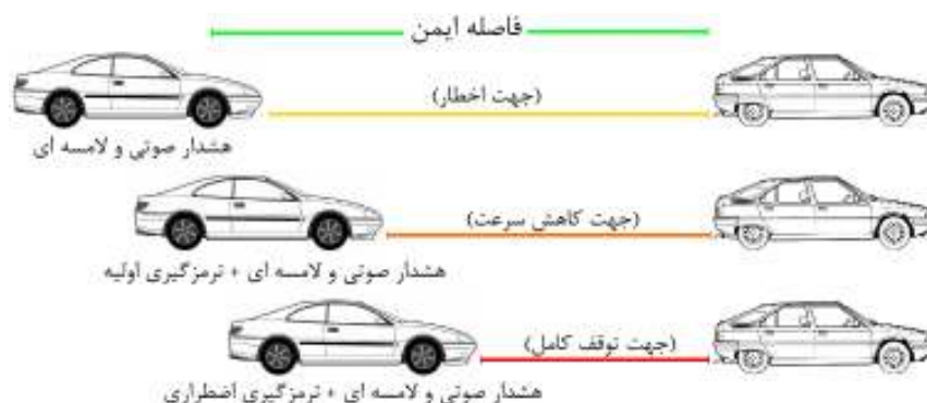
شکل ۲. سیستم جلوگیری از تصادف بر پایه ترمز اضطراری

سیستم با استفاده از دوربین و لیدار ۶ (رادار نوری) حضور عابر را همواره بررسی می‌کند. اگر عابری وجود داشت، فاصله آنرا با خودرو محاسبه کرده و در صورت لزوم به راننده هشدار می‌دهد. اگر راننده اهمیتی به هشدارها ندهد، با کاهش فاصله سیستم ترمز اولیه فعال شده و در نهایت خودرو متوقف می‌شود. نحوه عملکرد سیستم فوق بر پایه ترمز اضطراری در شکل ۲ نشان داده شده است.