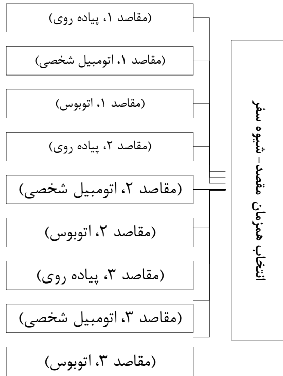
شکل ۲. ساختار مورد استفاده در مدل سازی هم زمان انتخاب مقصد - شیوه سفر