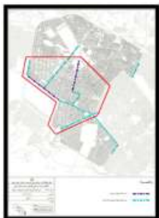
شکل ۳. مسیرهای دوچرخه موجود و مصوب در منطقه