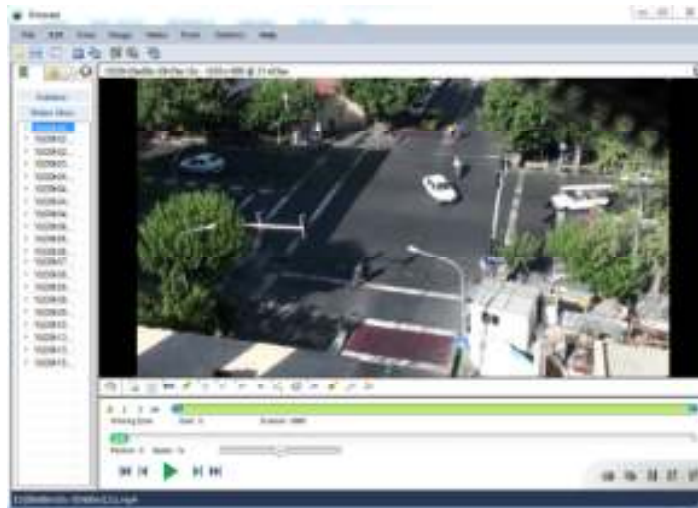
شکل ۴ برنامه کینووا به منظور دنبال کردن روی عابر و وسیله نقلیه