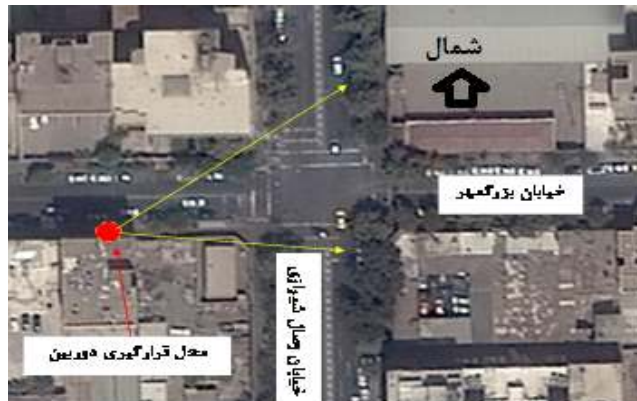
شکل ۳. تقاطع وصال به بزرگمهر