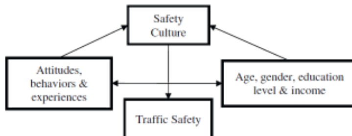
شکل ۱. رابطه بین مولفه‌های موثر بر فرهنگ رانندگی و ایمنی (Li et al., 2014)

تحقیقاتی که در بریتیش کلمبیا بر روی تصادفات فوتی مربوط به وسایل نقلیه سنگین حاوی کالای خطرناک باری صورت گرفت، معلوم شده است که مشخصات کلیدی تصادفات مزبور عبارتند از: سرعت، بی توجهی راننده، استفاده از مواد مخدر یا مشروبات الکلی، خستگی راننده، تصادفات خروج از مسیر، تصادفات برخورد از روبرو، وقوع تصادف در راه‌های بدون جدا کننده، راه‌های قوسی و شیب‌دار و شرایط ضعیف روسازی راه (شامل برف، یخ و ... (Evans, 2001). سه لاینه و همکاران (۱۳۹۴) در پژوهشی تحت عنوان «ارزیابی رفتارهای رانندگی در میان رانندگان حرفه‌ای ناوگان تجاری - باری با استفاده از پرسشنامه رفتار رانندگی منچستر (نمونه موردی استان تهران)» به بررسی وضعیت رفتارهای رانندگی و طبقه‌بندی آنها در میان رانندگان ناوگان عمومی جاده‌ای کشور در بخش جابجایی بار و کالا پرداختند. آزمودنی‌های این پژوهش که بخشی از یک مطالعات گسترده‌تر در خصوص بررسی رفتارهای رانندگان حرفه‌ای حوزه حمل و نقل جاده‌ای است، به صورت تصادفی و از میان رانندگان فعال درحوزه جاده‌ای انتخاب شده‌اند. ضمن آنکه برای تکمیل روند مطالعه، پرسشگری جدیدی نیز در سطح استان تهران و پایانه بار استان مدنظر قرار گرفته و هم پیمایی با بیش از ۲۰ راننده در طول روز و شب نیز انجام شده است. ابزار پژوهش، پرسشنامه استاندارد شده رفتارهای رانندگی منچستر است. یافته این تحقیق گویای آن بوده است که ارزیابی رفتار عمدی رانندگان حرفه‌ای با استفاده از پرسشنامه منچستر قابل اعتماد نبوده و اما رابطه معنادار موجود گویای آن است این پرسشنامه برای ارزیابی میزان تسلط رانندگان بر رفتارهای