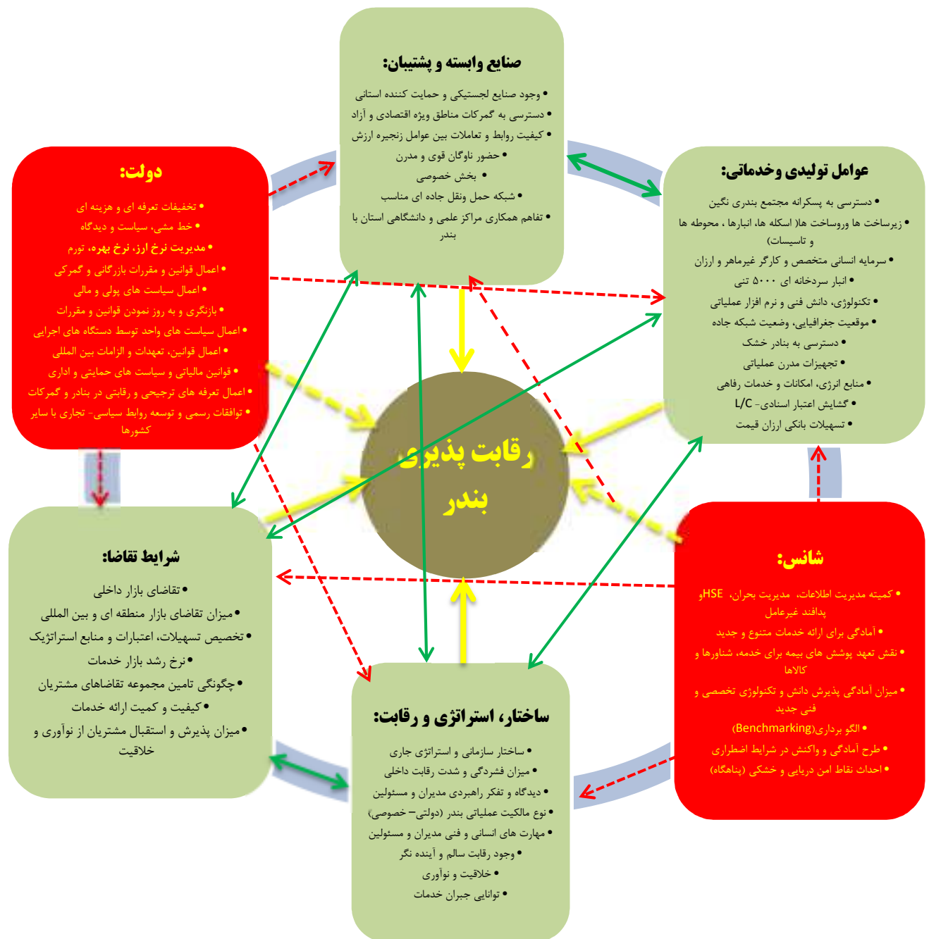
نمودار ۳. مدل نهایی