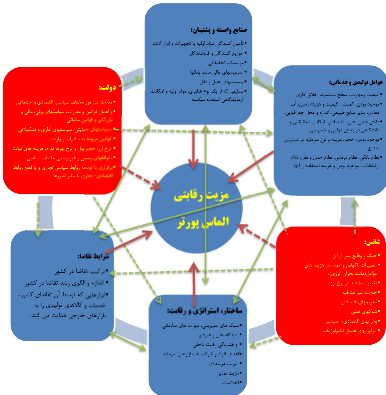
نمودار ۲. مدل مفهومی تحقیق

می‌شود. در بخش تحلیل توصیفی، آماره های توصیفی و نحوه پاسخگویی به سوالات مورد بررسی قرار گرفت که خلاصه هر کدام در قالب جدول ۱ ارائه می‌شود: