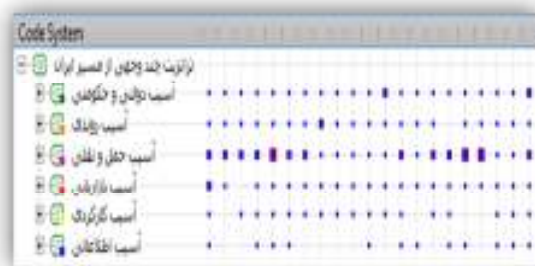
نمودار ۱. توزیع مفاهیم بین دهها بر اساس مصاحبه‌ها

شده است. طبق جدول شماره ۹ آسیب حمل و نقلی با تعداد ۱۶۰ کد تخصیص یافته مهم‌ترین عامل و پس از آن آسیب دولتی و حکومتی با تعداد ۸۱ کد در رتبه دوم اهمیت می‌باشد. آسیب بازاریابی با ۷۸ کد در رتبه بعدی قرار دارد. گاهی ممکن است تعداد کدهای شناسایی شده برای هر عامل حاصل تاکید یک یا تعداد اندکی از مصاحبه شوندگان باشد و به صورت کاذب باعث افزایش اهمیت مقوله گردد به طوری که مجموع کدهای به دست آمده مورد تایید و تاکید عموم افراد نباشد. لذا، میزان درصد فراوانی تعداد مصاحبه شوندگانی که به هر مقوله اشاره کرده‌اند مورد بررسی قرار می‌گیرد تا عمومیت و گستردگی طیف مقوله اشاره شده در کل افراد به دست آید. نتایج حاصل از خروجی نرم افزار در ادامه آورده شده است.