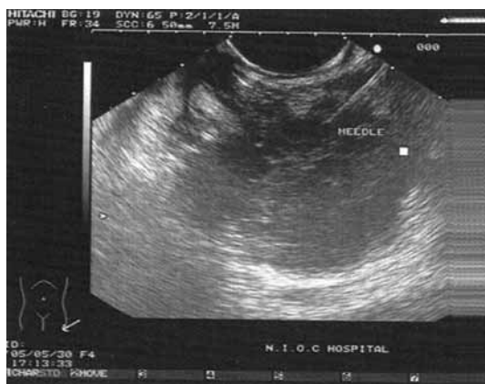
شکل ۱: تومور بدخیم در ناحیه سر پانکراس. سوزن بیوپسی مشخص است.

۲۶ بیمار جهت گرفتن بیوپسی از تومور پانکراس (۱۷ مرد و ۹ زن) مورد مطالعه قرار گرفتند که ۳ نفر توده دم پانکراس، ۴ نفر توده تنه پانکراس و بقیه (۱۹ نفر) توده سر پانکراس داشتند. در تمام این ۲۶ نفر FNA با موفقیت انجام شد (شکل ۱) که در ۱۶ بیمار (۶۱/۵٪) در همان جلسه پاسخ سیتولوژی تأییدکننده تومور بدخیم پانکراس بود. اسلایدهای ۱۰ بیماری که در آنها نتیجه منفی گزارش شده بود، توسط دو آسیب شناس دیگر در مرکز دیگری مورد بررسی قرار گرفت که در ۵ مورد وجود تومور بدخیم تأیید شد اما در ۵ بیمار (۱۹٪) دیگر گزارش اسلایدها از نظر وجود تومور در هر دو مرکز و توسط هر چهار آسیب شناس منفی بود. از بین این ۵ بیمار اخیر تومور در سی تی اسکن و آندوسونوگرافی چهار نفر نشان داده شد و شکی در مورد وجود آن باقی نبود؛ اما در یک بیمار گواهی تصاویر مربوط به سی تی اسکن و آندوسونوگرافی پیشنهادکننده تومور بود ولی با توجه به الکی بودن بیمار تردید در تشخیص وجود داشت، لذا بیمار به جراح معرفی و تحت عمل قرار گرفت. جراح نیز در حین عمل تشخیص تومور داد و از آن بیوپسی نمود، اما پاسخ آن پانکراتیت مزمن بود. چهار بیمار باقیمانده نیز با توجه به قطعی بودن تشخیص سرطان