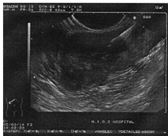
شکل ۲: تومور زیر مخاطی معده که با GIST مطابقت داشت.