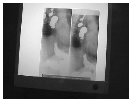
شکل ۲: گرافی بیمار با باریم و دیورتیکول های متعدد مری

در مانومتري بیمار انقباضات تنه مری پرستالتیک بودند و ارتفاع این انقباضات اغلب بالاتر از ۱۸۰ میلی متر جیوه بود. فشار پایه اسفنکتر تحتانی مری (LES) و میزان شل شدن آن در هنگام بلع طبیعی بود. بنابراین با توجه به عدم وجود انقباضات همزمان و طبیعی بودن LES تشخیص های مانند Diffuse Esophageal spasm (اسپاسم منتشر مری) و Hypertensive LES برای بیمار Nutcracker Esophagus و تشخیص (مانومتري بیمار در شکل ۳ آمده است)