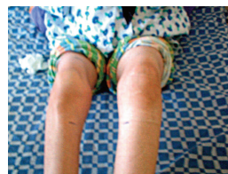
شکل ۲: پتشی و پورپورای اندام تحتانی بیمار

بیمار در روز پنجم بستری دچار درد و ادم یک طرفه اندام تحتانی چپ به همراه پتشی و پورپورای همان ناحیه گردید (شکل ۲).