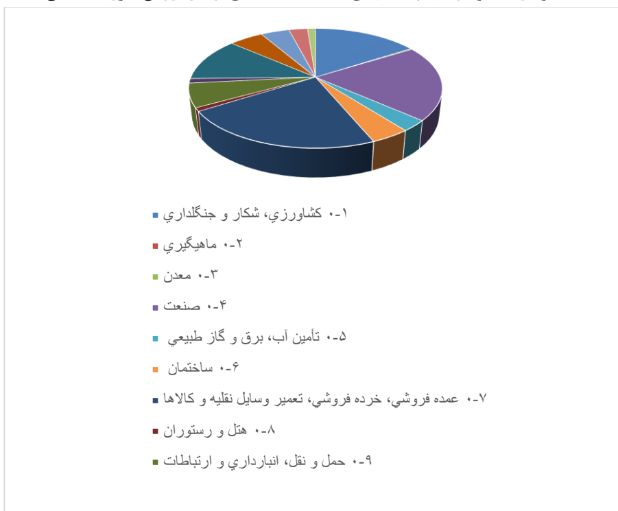
نمودار ۱. نمودار سهم بخشهای مختلف اقتصادی از کل ارزش افزوده استان

همان طور که در نمودار (۲) دیده می شود، نرخ ارز مؤثر واقعی در سال ۱۳۷۹ از مقدار ۲۳۳ شروع شده و سپس به مقدار ۶۷ در سال ۱۳۸۱ تنزل یافته و بعد از آن، رشد ملایمی داشته، که نشان دهنده این است که در نرخ ارز، بی ثباتی وجود دارد. نمودار نوسانات نرخ ارز به دست آمده از روش مارکوف- سوئیچینگ در نمودار (۲) نیز نشان داده شده است. با توجه به نمودار، بی ثباتی در نرخ ارز مؤثر واقعی مشاهده می شود.