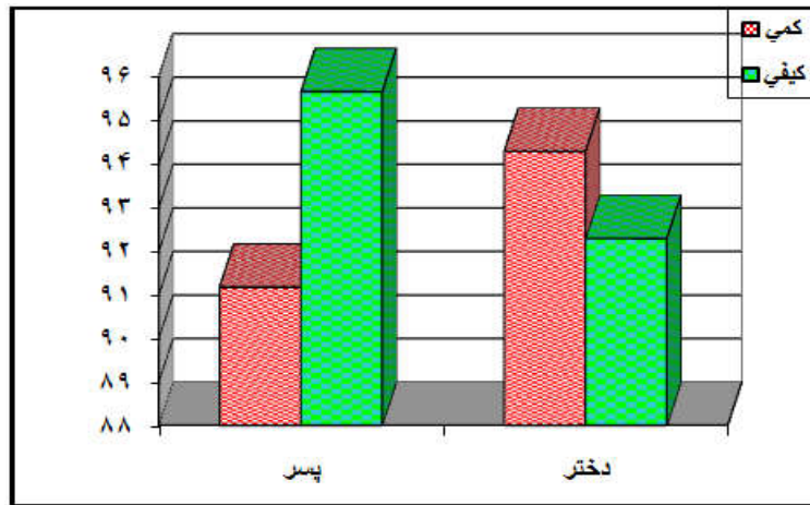
نمودار ۲: میانگین نمره خودکارآمدی به تفکیک جنس و نوع ارزشیابی

فرضیه ۲: خودکارآمدی دانش‌آموزان دختر و پسر مشمول ارزشیابی کمی در مقایسه با دانش‌آموزان مشمول طرح ارزشیابی توصیفی پایین‌تر است. نمودار ۲ نشان می‌دهد که میانگین خودکارآمدی دانش‌آموزان مشمول ارزشیابی کیفی در میان پسران بزرگتر از دانش‌آموزان تحت پوشش ارزشیابی سنتی (کمی) است. در حالی که درباره دختران خودکارآمدی افراد مشمول ارزشیابی توصیفی کوچک‌تر از گروه رقیب است. در واقع، به نظر می‌رسد که اثر تعاملی نوع ارزشیابی و جنس دانش‌آموزان معنادار است.