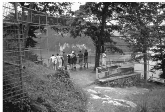
تصویر ۶- ۱۹۹۰ Voie Suisse, Lake Brunnen

از چندین دهه پیش تاکنون تلاش های متعددی شده تا مردم را در فرآیند های تصمیم گیری در خصوص مکان هایی که در آن ها زندگی، کار و استراحت می کنند سهیم نمایند.