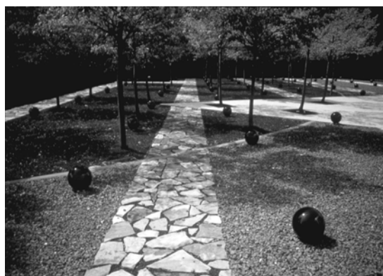
تصویر ۵- ۱۹۸۸ Center for Innovative Technology

هوبارد وکیمبال نیز معماری منظر را هنری ظریف تعریف کرده اند و مهم ترین عملکرد آن را ایجاد و حفظ زیبایی در مجاورت سکونت گاه بشر و در مقیاس بزرگتر گسترش چشم انداز های طبیعی اطراف و همچنین ارایه دهنده آسایش، راحتی و بهداشت برای شهر نشینان دانسته اند تا آنان بتوانند برای تجدید قوا و کسب آسایش و آرامش، به چشم اندازهای روستایی دسترسی داشته باشند(۸).