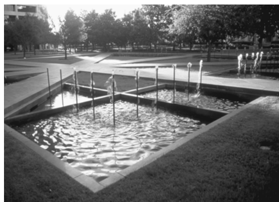
تصویر ۲- اثر پیتر واکر ۱۹۸۳ Burnett Park

بدون تردید یکی از جدی ترین و مهم ترین ارزش ها و رویکردهای معماری منظر کارکردهای اکولوژیکی آن است، این رویکرد در واقع از بستر اصلی این گرایش نشأت می گیرد که طبیعت است. و از آن جایی که معماری منظر در بخشی از وظیفه خود به عنوان یک علم که در طراحی، مدیریت و برنامه ریزی محیط های باز فعالیت دارد و می تواند منشأ تغییرات و تحولات مثبت و یا منفی باشد، پرداختن به