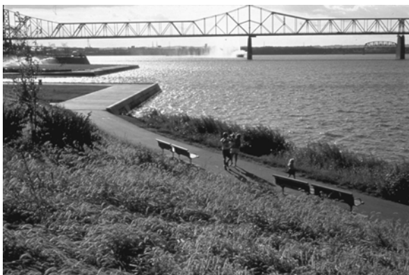
تصویر ۳-۱۹۹۰ Louisville Waterfront

هر کدام از عوامل فوق در ارتباط با هدف تحلیل و ساختار ذاتی منظر قرار می گیرد. برای مثال، در یک سامانه رودخانه ای می توان ارتباط سامانه هیدولوژی با ساختار بستر رودخانه را توسط فرایندهای مختلف مشاهده کرد. با این حال از آن جا که هر ناحیه ای معمولاً جزیره ای جداگانه از محیط اطرافش نیست، در تحلیل نباید الگوهایی با مقیاس های بزرگتر و کوچکتر از منطقه را نادیده گرفت.