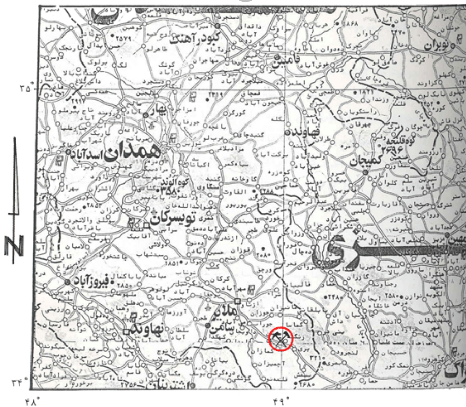
شکل ۱- نقشه موقعیت جغرافیایی معدن سرب و روی آهنگران

لازم به توضیح است که به علت شرایط نامناسب خاک در مناطق آلوده، استقرار و رشد گیاهان با مشکل مواجه می باشد (۲). به این دلیل، شناسایی گونه های مناسب گیاهی که شرایط سخت محیط را تحمل نموده و توانایی زیادی برای جذب و انباشت فلزات سنگین داشته باشند، در افزایش کارایی روش گیاه پالایشی تاثیر مهمی دارد. بررسی پوشش گیاهی در مناطق معدنی و تعیین غلظت فلزات سنگین در آن ها می تواند در شناسایی گونه های ابرانباشتگر مفید واقع شود. هدف اصلی این تحقیق، بررسی غلظت نیکل در تعدادی از گونه های طبیعی غالب در اطراف معدن سرب آهنگران واقع در جنوب شرقی استان همدان است.