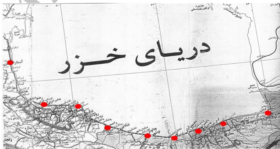
شکل ۱- ایستگاه های نمونه برداری در سواحل جنوبی دریای خزر

دریاچه خزر بزرگ ترین دریاچه جهان بوده و ۴۰٪ آب های دریاچه ای جهان را در خود جای داده است. این دریاچه از شمال به جنوب کشیده شده است. در حدود ۱۳۰ رودخانه به این دریاچه می ریزند که رودخانه ولگا مهم ترین رودخانه ای است که به آن منتهی می شود و ۸۰٪ آب آن را تامین می کند. کورا و اورال نیز به ترتیب ۶٪ و ۵٪ آب ورودی به دریاچه خزر را تشکیل می دهند (۲ و ۱). این رودخانه ها حامل سموم ارگانوکلره فراوانی هستند (۳). این دریاچه توسط پنج کشور ایران، روسیه، آذربایجان، قزاقستان و ترکمنستان احاطه شده است (۴). امروزه دریاچه خزر دچار بحران های زیست محیطی از جمله آلودگی های سموم ارگانوکلره، نفتی و ... می باشد. بنابراین شناخت ویژگی های زیست محیطی، منابع حساس بیوفیزیکی و کانون های آلوده ساز از سوی کشورهای ساحلی آن می تواند راهکاری مناسب در جهت کنترل و پیشگیری هر گونه بحران زیست محیطی را فراهم سازد. به دلیل محصور بودن دریاچه خزر، آلودگی هایی که در آن تخلیه می شوند، بعد از حرکت در سطوح آب، ته نشین شده و غالباً جذب رسوبات می گردند. تولیدات نفتی و همین طور پساب های شرکت های ساحلی که به دریا وارد می شوند، از منابع مهم آلوده کننده این دریا می باشند (۵). از این رو در این پروژه سموم ارگانوکلره لیندان، آلدین، دیلدین، هپتاکلر و ددت