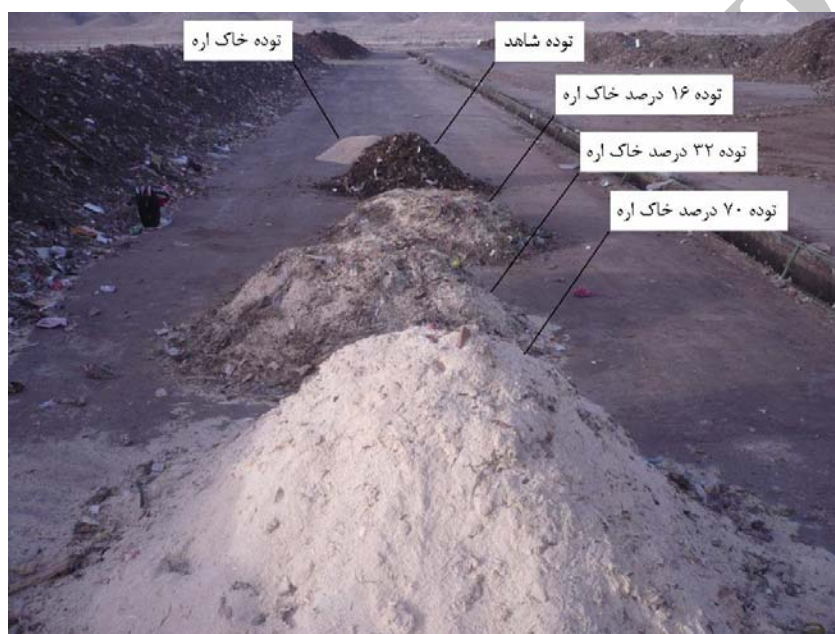
تصویر ۱- توده‌های تهیه شده جهت مطالعه

مطالعه حاضر در کارخانه بیوکمپوست شهر زاهدان، در محیطی سرباز و در فصل تابستان انجام یافت. ۴ توده زباله خام با اندازه ۱ متر مکعب پس از تفکیک توسط سرند ۳۰ میلی‌متری در کارخانه و جداسازی مواد فلزی، پلاستیک، شیشه