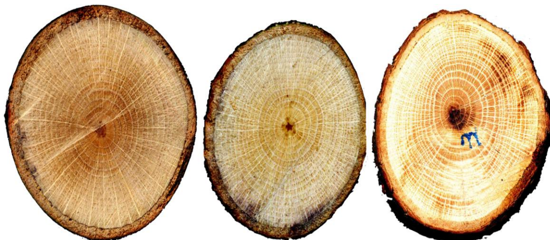
شکل ۱- نمونه‌هایی از دیسک‌های تهیه شده