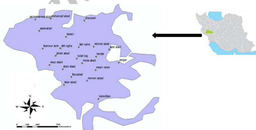
شکل ۱- موقعیت محدوده مطالعاتی در استان لرستان

یابی اطلاعات استفاده نمایند. اما با رسم نیم- تغییرنماها و تفسیر آن ها چون همبستگی خاصی بین اطلاعات دیده نشد، روش کریجینگ مناسب تشخیص داده نشده و به جای آن روش رگرسیون چندگانه استفاده گردید (۶). در مطالعه Mckenna، اطلاعات بارندگی برای ۶۰ نقطه به دست آمده و در نهایت با محاسبه میزان خطای باقی مانده نسبی به این نتیجه رسیدند روش رگرسیون چندگانه نتایج بهتری نسبت به روش فاصله معکوس دارد. برای بالا بردن دقت در تخمین و شبیه سازی داده های مؤثر بر جریان آب های زیر زمینی در ایالت کلرودای آمریکا از روش های زمین آماری که مبتنی بر استخراج تغییر نما (variogram) بود استفاده کرد. نتایج این آزمایش حاکی از این است که استفاده از روش های زمین آمار معمولاً علاوه بر بالا بردن دقت تخمین داده ها می تواند باعث کم تر شدن تعداد نمونه برداری ها شود (۷). در مجموع با توجه به پژوهش های انجام گرفته و همچنین اهمیت دشت نورآباد از لحاظ شرب و کشاورزی، درون یابی سطح آب زیرزمینی به منظور پیش بینی و اقدامات مدیریتی جهت بهبود آب آن با استفاده از روش های زمین آمار و مقایسه نتایج آن با شبکه عصبی مصنوعی از جمله اهداف پژوهش حاضر در نظر گرفته شده است.