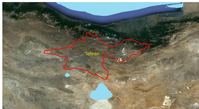
شکل ۱- موقعیت جغرافیایی شهر تهران. Figure 1. The Location of Tehran city.

برای نمونه برداری از آب بارش دو ایستگاه همدیدی اقدسیه و مهرآباد سازمان هواشناسی و برای مطالعه خردفیزیک ابر پنج منطقه اقدسیه، دانشگاه علوم و تحقیقات تهران، موسسه ژئوفیزیک دانشگاه تهران، مهرآباد و دوشان تپه انتخاب شده اند. در جدول (۲) طول و عرض جغرافیایی مکانهای انتخاب شده نوشته شده است.