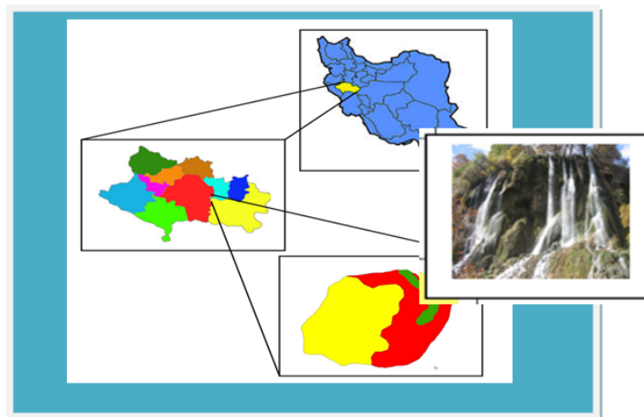
شکل ۱- موقعیت جغرافیایی آبشار بیشه لرستان

بسط فعالیت های گردشگری به مناطق بیابانی، کوهستانی، دریاچه ها و جاذبه های شاخص ژئوتوریسم و تهدیدهای احتمالی همه این محیط های زیست افزایش خواهد یافت، مگر آن که توسعه پایدار و اصول و فرآیندهای مدیریت در استفاده از آن ها اعمال گردد. یکی از مهم ترین عوامل بررسی پایداری جاذبه های