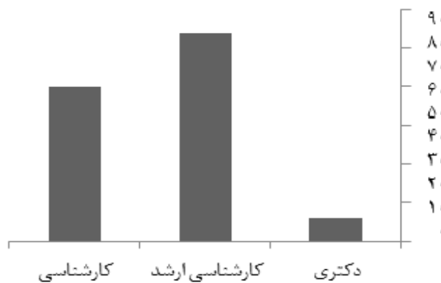
نمودار ۲- درصد مقطع تحصیلات افراد پاسخ دهنده