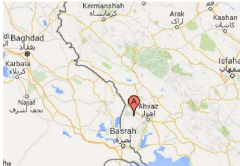
شکل ۱- موقعیت جغرافیایی منطقه مورد مطالعه واقع در هویزه