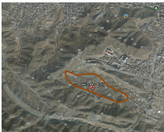
شکل ۱- تصویر محدوده‌ی پارک کوهستانی خورشید