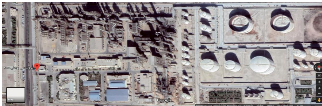
شکل ۱- موقعیت جغرافیایی بندر ماهشهر (پتروشیمی بوعلی سینا)

نمونه های خاک آلوده به ترکیبات نفتی از محل نگهداری مخازن نفتی واقع در شرکت بوعلی سینا، منطقه ویژه اقتصادی ماهشهر واقع در بندر امام خمینی استان خوزستان در شرایط استاندارد جمع آوری گردید (نقشه ۱). نمونه برداری از عمق ۳۰-۵۰ سانتی متری خاک به وزن ۵۰۰ گرم و طبق روش استاندارد در ظروف استریل شیشه ای به آزمایشگاه جهت انجام