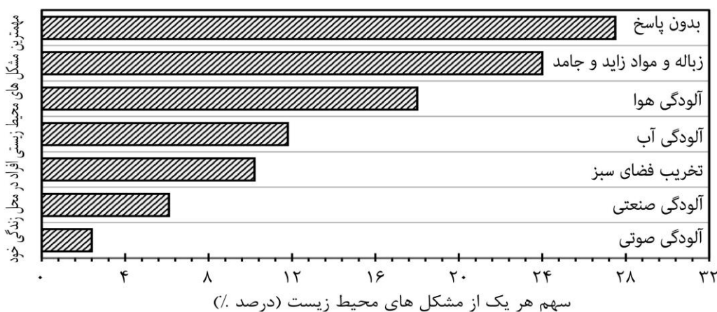
نمودار شماره ۲- مهم‌ترین مشکلات محیط زیستی افراد در محل زندگی خود

پس از ارزیابی پرسش‌نامه، سطح آگاهی در حوزه عوامل رفتاری موثر مورد بررسی قرار گرفت که جزییات پرسش‌ها به شرح زیر می‌باشد. مخاطبین در پاسخ به این پرسش که "در مجموع کیفیت محیط‌زیست خود را چگونه ارزیابی می‌کنید؟" بیش از ۶۹/۹۰ درصد پاسخ "خیلی خوب تا خوب" را انتخاب و ۳۰٪ کیفیت محیط‌زیست خود را "بد تا خیلی بد" ارزیابی نموده‌اند. در نمودار شماره ۲ مشکلات مربوط به دفع فاضلاب‌های شهری و مدیریت پسماند و بازیافت زباله، آلودگی هوا، تخریب فضای سبز، آلودگی-