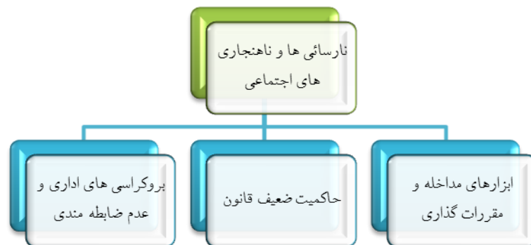
شکل ۳- مقررات گذاری ناقص و نارسایی ها

می رسد روح همکاری و تعامل در ساختارهای تصمیم ساز و تصمیم گیر تا حد زیادی تنزل یافته و چشم گیر نبوده است. در اثر بروکراسی های اداری و عدم ضابطه مندی، مقررات گذاری با مشکل روبرو شده است. هر چند گاه این مشکل برآمده از ناهنجاری و ناهمگونی های ساختاری است. همین امر سبب گردیده تا بحران هایی از جمله بحران محیط زیستی در جامعه نمود پیدا کند.