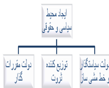
شکل ۲- چارچوب سیاست گذار

حفاظت از محیط زیست هر دونه مقررات گذاری اجتماعی و اقتصادی رادر بر دارد، زیرا منشأ مشکلات مربوط به آن، معمولاً ماهیت اقتصادی و اثرات منفی آن ها غالباً ماهیت اجتماعی دارند. در این راستا دولت نقش زمینه سازی و بستر سازی مناسب برای تحقق ساختار مطلوب دارد.