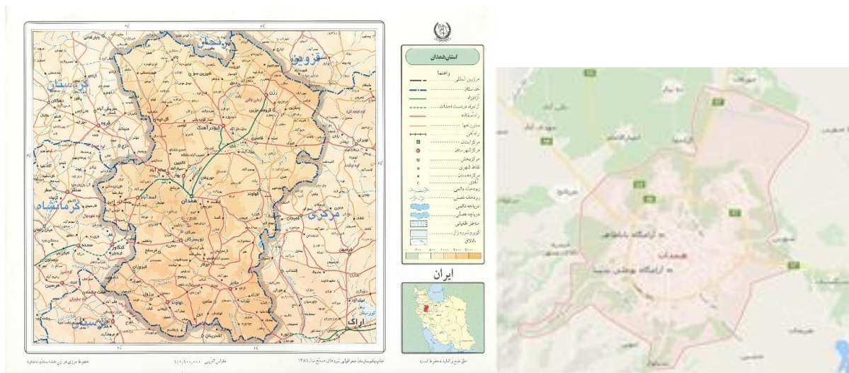
شکل ۱- موقعیت شهر همدان

شهر همدان، در مرکز استان همدان در ارتفاعات غربی ایران و در منطقه کوهستانی رشته کوه زاگرس قرار گرفته است. متوسط ارتفاع این شهرستان از سطح دریا حدود ۱۸۵۰ متر است. درموقعیت جغرافیایی ۳۳ درجه و ۵۹ دقیقه تا ۳۵ درجه و ۴۴ دقیقه شمالی و ۴۷ درجه و ۴۷ دقیقه و ۴۹ درجه و ۳۹ دقیقه