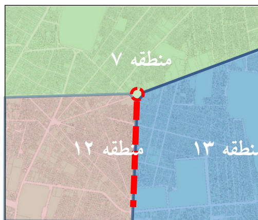
شکل ۱- نقشه موقعیت محدوده مورد مطالعه

صفا تا میدان شهدا برای عبور و مرور وسایل نقلیه بازگشایی شد. در این تحقیق داده ها به صورت پیمایشی و با کمک پرسشنامه ای مبتنی بر چارچوب نظری، شاخص های مورد بررسی و فرضیات تحقیق جمع آوری شده است. جامعه آماری این تحقیق افراد مستقر در مجاورت میدان امام حسین و پیاده راه ۱۷ شهرپور و استفاده کنندگان از این فضاها هستند؛ که ۶ محله نظام آباد، دهقان- گرگان و خواجه نصیر- حقوقی (در منطقه ۷ شهرداری تهران)، صفا و شهید اسدی (در منطقه ۱۳ شهرداری تهران) و محله دروازه شمیران (در منطقه ۱۲ شهرداری تهران) را شامل می شوند. جمعیت جامعه آماری این تحقیق در حدود ۱۱۲۵۱۶ نفر می باشد که حجم نمونه طبق فرمول کوکران ۳۸۳ نفر است. قلمرو زمانی این پژوهش نیز دی ماه ۱۳۹۷ می باشد.