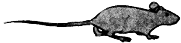
شکل ۱- نمای یک موش خانگی

موش خانگی موشی است با دم دراز و چشمهای ریز و لاله گوش نسبتا بزرگ و مدور (شکل ۱) موش خانگی معمولا از تمام مواد غذایی انسان تغذیه می‌نماید ولی حبوبات و غلات و خوراکی‌های چرب و شیرین را ترجیح می‌دهد این جوندگی شب فعال بوده و روزها گاهی در زیر زمینها و انبارها و جاهای نسبتا تاریک دیده می‌شود از ویژگی‌های موش خانگی عدم نیاز این موجود به نوشیدن آب می‌باشد و آب مورد نیاز برای بقای خود را از طریق مواد غذایی خورده شده بدست می‌آورد. موش خانگی تقریبا در تمام مناطق ایران به استثناء قسمت‌های کاملا خشک و نامساعد نظیر کویر نمک و لوت به صورت نیمه اهلی در اماکن مسکونی و به صورت اجتماعات کاملا وحشی در مناطق غیر مسکونی مشاهده می‌شود اما با توجه به جثه کوچک موش خانگی احتمال اشتباه آن با رتهای جوان و نابالغ وجود دارد که به منظور تشخیص آنها مقایسه اندازه سر و پای موش مورد توجه قرار می‌گیرد که در موش خانگی اندازه سر و پاها نسب به بدن کوچک تر از اندازه‌های مذکور در رتها جوان می‌باشد (شکل شماره ۴).