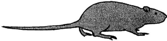
شکل ۲- نمای یک موش نروژی

موشی است با جثه بزرگ و پوزه‌ای پهن، طول دم آن از مجموع طول سر و تنه کوتاه تر بوده و لاله گوش کوچک می‌باشد به نحوی که اگر به سمت جلو خم شود به سختی به چشم موش می‌رسد (شکل ۲). این موشها در شالوده ساختمان، زیر توده‌های زباله و یا چوب، زمین‌های مرطوب، مجاری فاضلاب و اماکن مشابه لانه سازی می‌نمایند و ممکن است لانه خود را با خورده کاغذ و مواد سلولزی مشابه فرش نمایند. موش نروژی شناگر بسیار قابلی بوده و در بندرگاه‌ها به وفور یافت می‌شود عادت به نوشیدن آب و حساسیت به کمبود آن موجب گردیده که زیستگاه خود را در مناطقی که آب کافی در دسترس باشد انتخاب نماید، این جوندگی تغذیه از گوشت و ماهی را ترجیح می‌دهد ولی از دیگر مواد غذایی نظیر دانه‌های حبوبات و غلات، خشکبار و میوه‌ها نیز تغذیه می‌نماید در شرایط استرس غذایی هم‌نوع خواری (Cannibalism) بصورت شکار موشهای ضعیف تر از گونه‌های دیگر و یا هم گونه مشاهده می‌شود. موشهای نروژی معمولا مسافت ۳۰ تا ۵۰ متر اطراف لانه را به منظور بدست آوردن غذا جستجو می‌نمایند حضور و فعالیت موش نروژی علاوه بر مناطق ساحلی دریای خزر و سواحل خلیج فارس و دریای عمان از بسیار شهرهای بزرگ کشور نیز گزارش شده است. (شکل ۴).