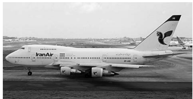
تصویر ۲- کابین فشار دار شده در هوانوردی غیر نظامی

در طول جنگ جهانی اول با افزایش خلبانان و کادر پروازی و با پیشرفت صنعت هواپیمایی (افزایش سرعت و ارتفاع پرواز)، مشکلات دندانی بیشتر احساس شد، به طوری که طی جنگ جهانی دوم درد دندانی ناشی از تغییرات سریع و ناگهانی فشار هوا در گروه پرواز به طور جدی نظر محققین را به خود جلب نمود (۱۰). با افزایش میزان بروز بیماری های مرتبط با دندان در صنعت هوانوردی خصوصا در حیطه نظامی، دندان پزشکی هوایی جایگاه خود را در