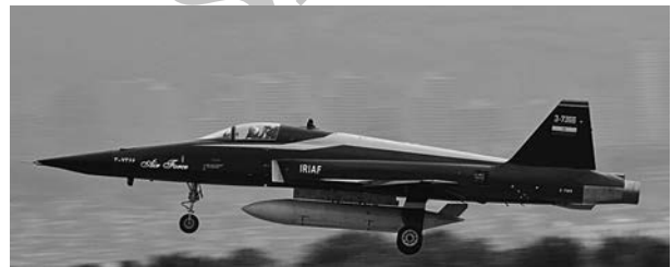
تصویر ۱- کابین غیر فشار دار شده در هوانوردی نظامی

احتمال وقوع بارودنتالژی در ارتفاعات بالاتر از ۳ هزار متر و اعماق بیش از ۱۰ متر وجود دارد که با افزایش ارتفاع یا عمق بر میزان وقوع آن افزوده می شود (۱۱، ۲).