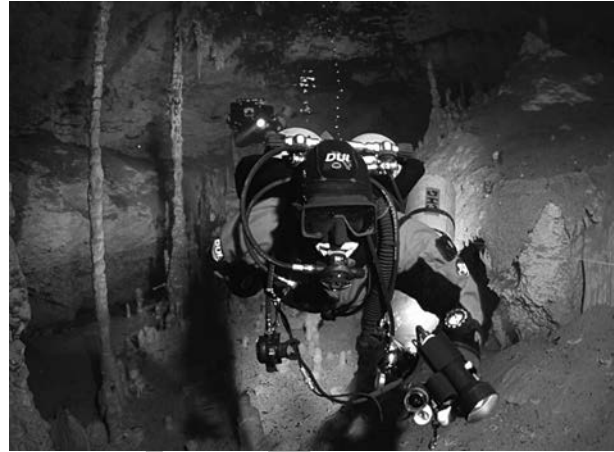
تصویر ۴- Scuba Diving

(Breathing Apparatus) فعالیت داشته‌اند، ۹/۲ درصد حداقل یک بار مبتلا به بارودنتالژیا شده‌اند (۱۵، ۶).