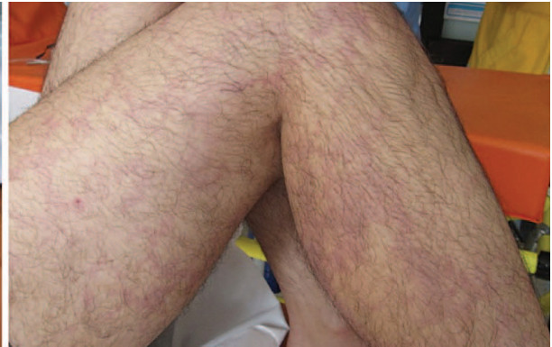
تصویر ۲- Bends پوستی