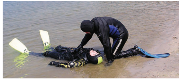
تصویر ۵- درمان در محل

لذا بر کلیه نیروهای مسلح ج.ا.ا واجب است تا با استعانت از ایزد منان، تکیه بر دانش روزآمد، بهره‌گیری از تمامی امکانات و تجربیات و همکاری متقابل ضمن انجام پیشگیری‌های مناسب همواره آماده برخورد مناسب با خطرات احتمالی باشند.