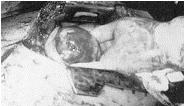
شکل ۲- بررسی محل ترمیم از نظر پارگی ثانویه و محل خروج چاقو

توسط چاقو شدیم که برای ترمیم آن اقدام خاصی صورت نگرفت لوله سینه دیگری در حفره پلور چپ قرار داده شد و جدار توراکس ترمیم گردید. محل ترمیم شده زخم در شکل ۳ آورده شده است.