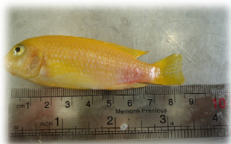
تصویر ۱: Labidochromis caeruleus

برای انجام این تحقیق تعداد ۱۲۰ قطعه ماهی ماکرو (بدون در نظر گرفتن جنسیت) با میانگین وزن اولیه‌ی 6/5 \pm 0/65 گرم و با میانگین سن ۲ ماه از یکی از مراکز پرورش ماهیان زیتنی اهواز خریداری شد. برای این کار ۱۲۰ قطعه ماهی به طور اتفاقی به چهار گروه تقسیم شده (هر آکوارיום حاوی ۳۰ قطعه ماهی) و به مدت ۶۰ روز برای انجام آزمایش، نگهداری و غذادهی شدند (تصویر ۱). جیره‌ی غذایی روزانه بر اساس ۲ درصد وزن بدن ماهی‌ها در نظر گرفته شد و سه بار در روز غذادهی انجام می‌شد. تیمار اول، دوم و سوم به ترتیب با مقادیر ۵، ۱۰ و ۱۵ گرم عصاره‌ی اتانولی جلبک سارگاسوم به ازاء هر کیلوگرم غذا به مدت دو ماه تغذیه شدند. تیمار چهارم، گروه شاهد بود که فقط غذای تجاری (بیومار) که با روغن زیتون پوشش داده شد، دریافت می‌نمود. غذای حاوی عصاره‌ی جلبک نیز مشابه گروه شاهد با روغن زیتون پوشش داده شد (Costa et al. 2013).