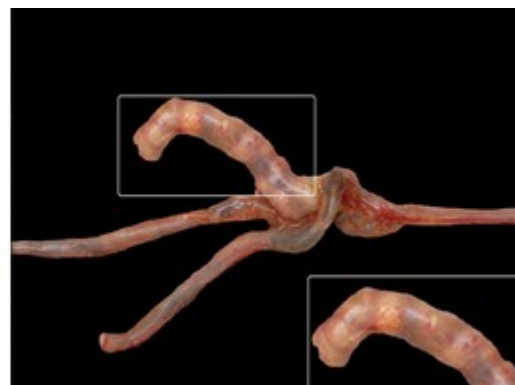
تصویر ۳: مقطع طولی از سطح مخاطی سکوم که در بر گیرنده‌ی ضایعه‌ی بیضی‌شکل و اکسودای پنیری (تصویر سمت چپ، نوک قیچی) و تورم شاخه سکوم (تصویر سمت راست) دیده می‌شود.