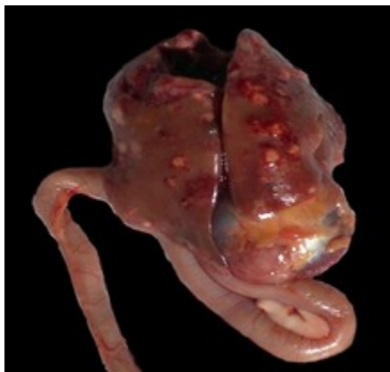
تصویر ۲: کبد، دوازدهه و سنگدان. ندول‌های سفید متمایل به زرد در اندازه‌های مختلف در بافت کبدی دیده می‌شود.

این مطالعه بر روی گله‌ی کبک مولد (۸۵۰۰ قطعه) با تلفات قابل توجه ارجاعی به بیمارستان دامپزشکی دانشگاه شهید چمران اهواز صورت گرفت. شرایط پرورشی گله به صورت صنعتی و در فضای باز محصور شده توسط توری بود. از ۲۳ هفتگی نشانی‌های بیماری در گله ظاهر شده و کبک‌ها دچار رفتار غیرطبیعی، عدم تمایل به حرکت، نشستن روی مفاصل و بال‌های آویزان و پره‌ای ژولیده شدند. مصرف آب و خوراک نیز به طور محسوسی کاهش یافت. میزان تلفات، ۳/۳۶ درصد (۲۰/۴ کبک/روز، ۱۴۳ کبک در هفته) در طی مدت حدوداً ۲ هفته بود. در معاینه بالینی کبک‌های ارجاعی (۲۷ کبک) لاغری مفرط، کم‌خونی مخاطات، تاج و ریش و پره‌ای اطراف کلواک آغشته به مدفوع بود. در اکثر لاشه‌های کالبدگشایی شده محوطه‌ی شکمی نسبت به حالت طبیعی متورم به نظر می‌رسید. در کالبدگشایی اکثر لاشه‌ها هنگام باز کردن محوطه‌ی بطنی، مایع شفاف وجود داشت. بلافاصله بعد از باز کردن محوطه‌ی شکمی، کبد متورم و حاوی ندول‌های سفید متمایل به زرد (با قطر ۷-۱ میلی-متر) در سطح کبد که در اطراف آن خون‌ریزی به وضوح آشکار بود، دیده شد (تصویر ۱). بعد از قطع محل اتصال پیش‌معه به مری، سنگدان، پانکراس و دوازدهه (تصویر ۲)، ژژنوم و ایلیوم بازرسی شده و از نظر ظاهری ضایعه‌ای مشاهده نشد. در بررسی روده‌ی کور نقاط کازئوسی و