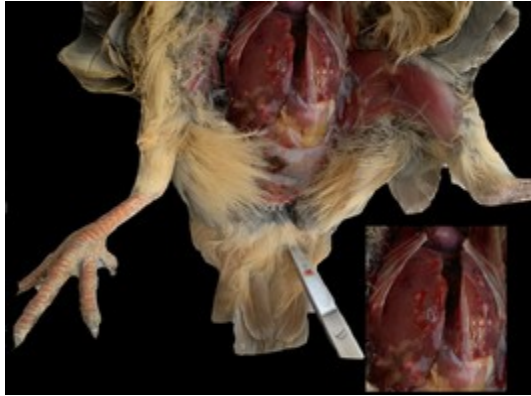
تصویر ۱: سطح سروزی کبد در کبک کالبدگشایی شده قابل مشاهده است. ندول‌های سفید متمایل به زرد در بافت کبد دیده می‌شود.

افزایش ضخامت دیواره و تورم سکوم دیده می‌شود (تصویر ۳).