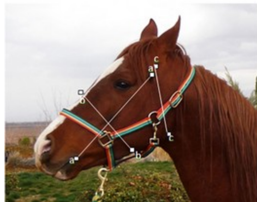
تصویر ۱: نقاط اندازه‌گیری شده از نمای جانبی سر اسب عرب خالص ایرانی (نریان ۸ ساله) a-a: طول جانبی صورت b-b: ارتفاع سر c-c: ارتفاع شاخ فک پایینی