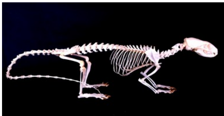
تصویر ۳: نمای جانبی از اسکلت کامل خدنگ ماده (تهیه شده به وسیله‌ی نویسنده)

در مطالعه‌ی حاضر و پس از تهیه‌ی اسکلت کامل خدنگ نر و ماده مشخص گردید که در هر دو جنس خدنگ بالغ ستون مهره‌ای دارای ۵۸ تا ۶۲ مهره است (تصویر ۳). به طوری که ۷ مهره‌ی گردنی، ۱۳ مهره‌ی سینه‌ای، ۷ مهره‌ی کمری، ۳ مهره‌ی خاجی و ۲۸ تا ۳۲ مهره در ناحیه‌ی دمی موجود می‌باشد. لازم به ذکر است که در تمامی موارد تشریح شده حیوانات نر تعداد مهره‌های دمی بیش‌تر (یا مساوی) به نسبت ماده‌ها داشتند. تعداد این مهره‌ها در جنس نر ۳۰ تا ۳۲ عدد و در جنس ماده ۲۸ تا ۳۰ عدد شمارش گردید. بنابراین بزرگ‌تر بودن جثه در جنس نر این حیوان به نسبت جنس ماده، به شکل مشخص و معنی‌داری در ناحیه‌ی دمی خود را نشان می‌دهد. میانگین وزن کلی بدن در جنس نر ۱۲۲/۵۹ \pm