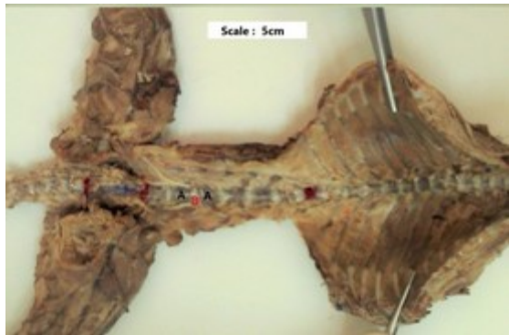
تصویر ۲: نمای شکمی از ستون مهره‌ای خدنگ بالغ مهره‌های کمری (A)، دیسک بین مهره‌ای کمری (B)

با محاسبه‌ی نسبت طول نخاع شوکی در نواحی مختلف این ساختار، به طول ستون مهره‌ای در نواحی ذکر شده، ضریب رشد آلومتریکی ناحیه‌ای و کلی تعیین گردید. اعداد و ارقام به دست آمده از اندازه‌گیری‌های ماکروسکوپیکی به تفکیک جنسیت، به کامپیوتر داده شده و به منظور آنالیز آماری از برنامه‌ی SPSS (نسخه ۲۲) و آزمون T (T.student) استفاده گردید و سطح P \leq 0/05 برای معنی‌دار بودن اختلاف بین داده‌ها در نظر گرفته شد.