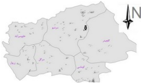
تصویر ۱: محل زنبورستان تحت مطالعه در اطراف شهرستان مریوان (فلش).

ترین و کم‌ترین میانگین بارندگی سالانه ۱۸۴/۵ میلی‌متر و میانگین دمای سالانه ۲۸-۲۲ درجه‌ی سانتی‌گراد است (تصویر ۱).