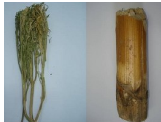
تصویر ۳: گیاه فرولا سودآلیاسه‌آ: ساقه (الف) و ریشه (ب).

گیاه هنگوان بومی منطقه‌ی مریوان در استان کردستان است که در اواسط بهار از کوه‌های اطراف این مناطق جمع‌آوری گردیده و برای عصاره‌گیری به آزمایشگاه مرکزی دانشکده دامپزشکی ارومیه منتقل شد (تصویر ۳). برای عصاره‌گیری از گیاه فرولا سودآلیاسه‌آ در ابتدا آن را در فور با دمای ۴۰ درجه‌ی سانتی‌گراد خشک کرده و بعد با استفاده از دستگاه روتاری در دمای ۴۵ درجه‌ی سانتی-گراد و سرعت ۱۰۰ دور در دقیقه عصاره‌گیری انجام شد. به این منظور از قیف بوخنر برای تصفیه و خالص‌سازی آن توسط نیروی مکش استفاده شد.