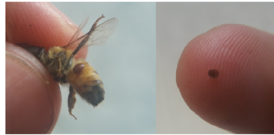
تصویر ۲: جرب واروآ دستراکتور انگل خارجی جدا شده از زنبور عسل در زنبورداری‌های اطراف شهرستان مریوان.

نتایج این مطالعه بیان‌گر وجود ارتباط معنی‌دار بین میزان اثر گروه تیمار عصاره‌ی فرولا سودآلیاسه‌آ ( 34/40 \pm 9/652 ) در مقایسه با گروه شاهد ( 3/6 \pm 1/342 ) در کشتن جرب‌های واروآ دستراکتور بود (نمودار ۱)